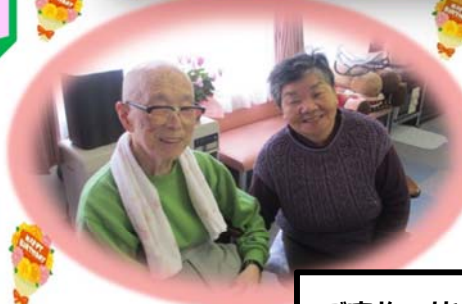
ご家族の皆さんと♡